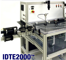
インターベンション 機器試験装置