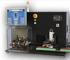
マーカースバンドかきめ機