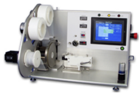
自動ステントクリンプ装置 (フィルムヘッド付き)