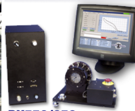
ラジアル拡張力試験装置